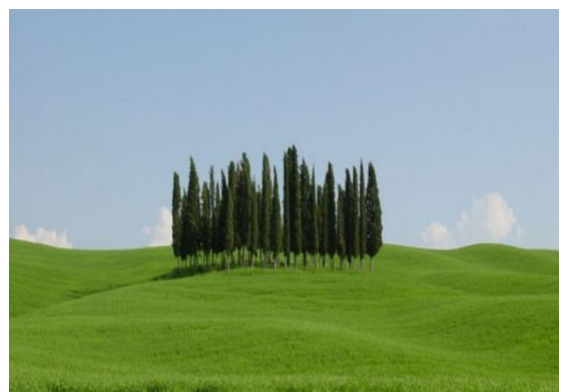
Gloria FUERTES, Poesía completa .

Yo no estoy triste, Es que estoy en un sitio Al que nadie viene con sonrisas. Yo no estoy triste, Es que todo el que viene aquí Parece como si le faltara algo. Yo no estoy triste, y si no que lo digan los pájaros. A ver, ¿Qué tienen otros pájaros que no tenga yo? Yo no estoy triste, Lo que pasa es que todos me miran con tristeza.