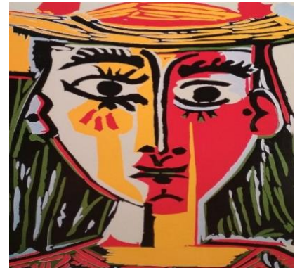
PICASSO, Mujer (detalle)