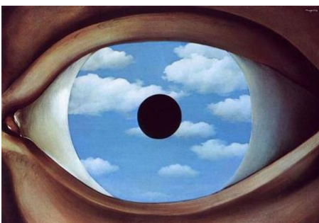
MAGRITTE, Falso espejo.